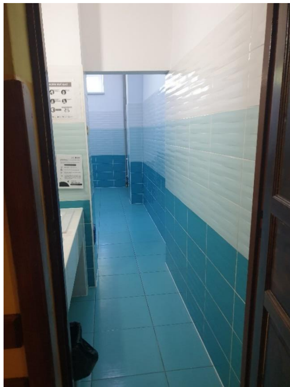
Fot. Istniejące łazienki po modernizacji